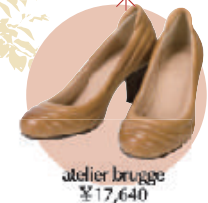
atelier brugge ¥17,640